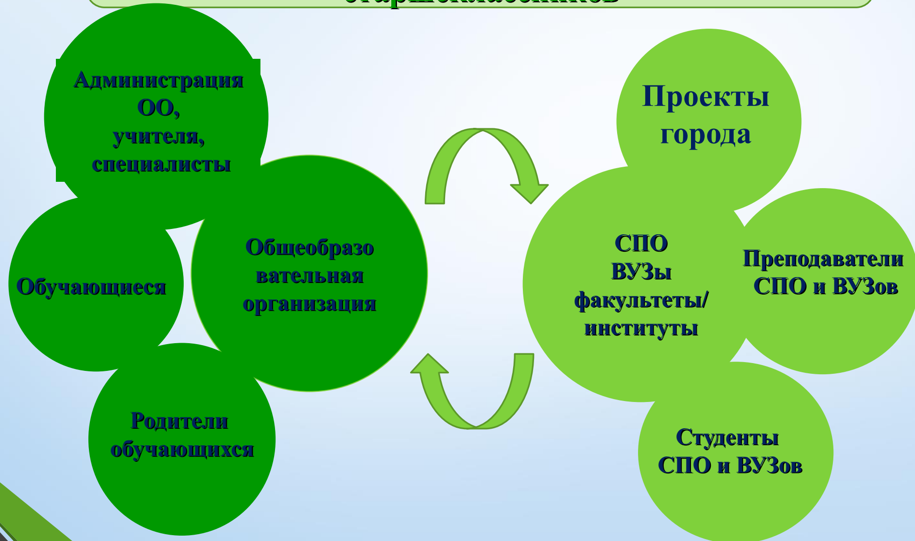
Схема взаимодействия участников педагогической практики по профориентации старшеклассников